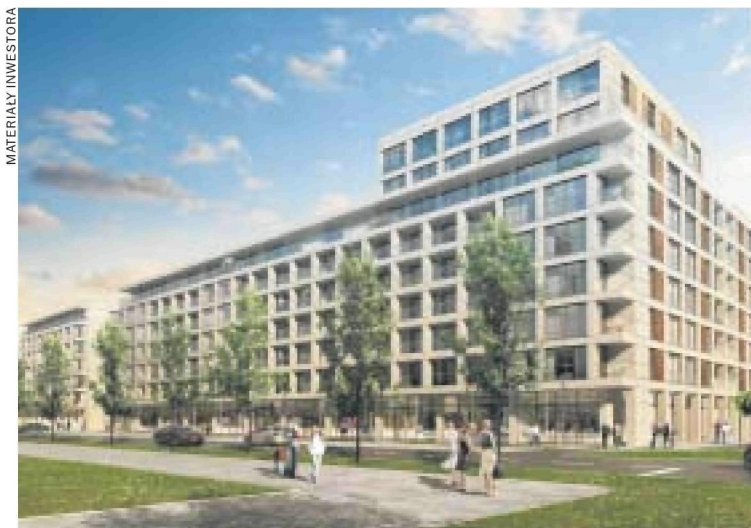
Drugi etap osiedla Luxor firmy Longbridge

Na Służewcu powstał milion metrów kwadratowych biur, ponad jedna czwarta całej powierzchni biurowej w Warszawie. W sporej mierze to dzielnica widmo, w której po 18 nie widać na ulicach żywego ducha. Życie toczy się tylko w enklawie pomiędzy Marynarską, Bokerską i Obrzeżną. Tam swoje osiedla budują i rozwijają m.in. firmy Eco Classic, Park Project, Longbridge, Arche oraz