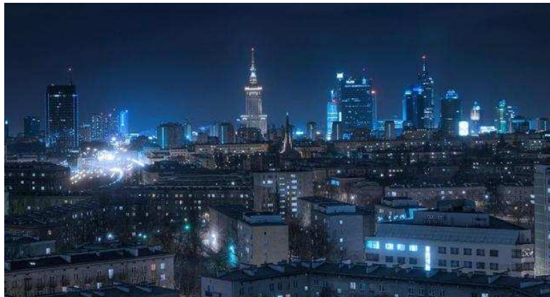
Widok na Warszawę z okolic TRIO

Zespół apartamentowy TRIO jest zlokalizowany w szczególnym miejscu – pomiędzy dwiema najbardziej ekskluzywnymi dzielnicami Warszawy- Śródmieściem i Żoliborzem, przy skrzyżowaniu ulicy Stawki z ulicą Pokorną. Łagodny łuk ulicy Stawki powoduje, że bryła budynku zamyka optycznie perspektywę w kierunku Wisły i sprawia, że część ulicy staje się naturalnym przedpołem dla inwestycji.